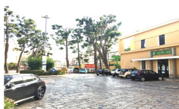
10 PIAZZA VITTORIO EMANUELE