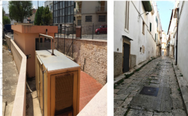
3 LARGO PORTA GRANDE CANALONE