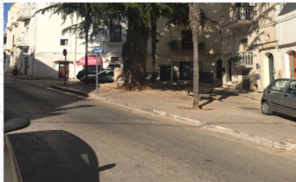
9 VIA MAZZINI