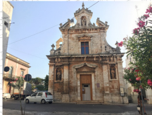
8 SAGRATO CHIESA DEL CAROSENSO