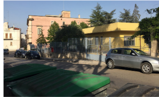
5 SCUOLA DELL'INFANZIA VIA PUTIGNANO