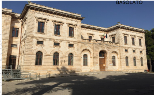
6 SCUOLA ELEMENTARE A. ANGIULLI