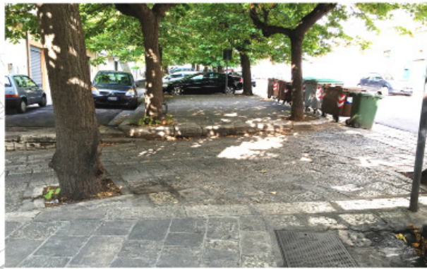
1 VIA FRATELLI BANDIERA