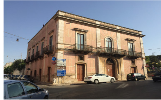
2 PALAZZO DELL'ERBA