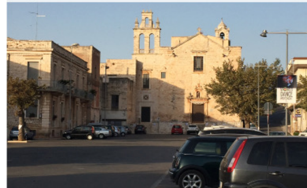
7 LARGO SAN GIUSEPPE